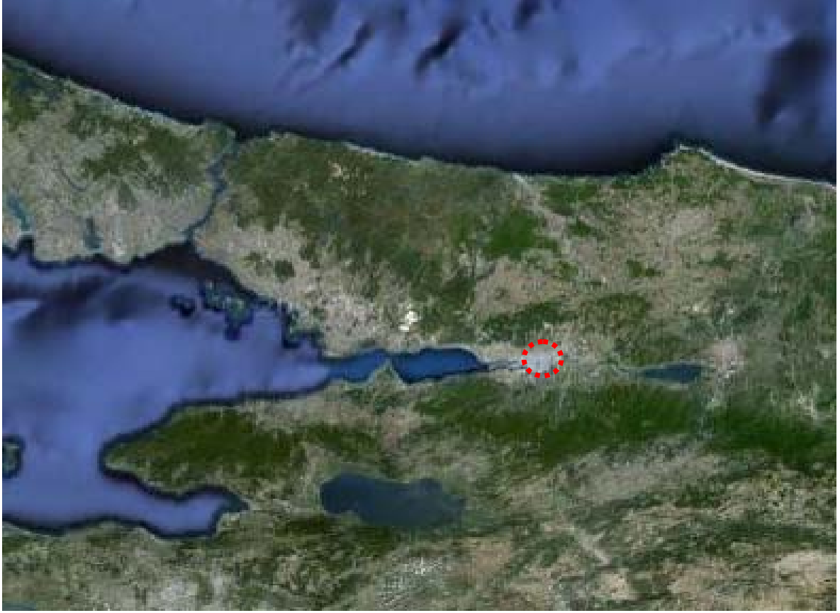
Resim 10: Yarışma Alanının Konumu