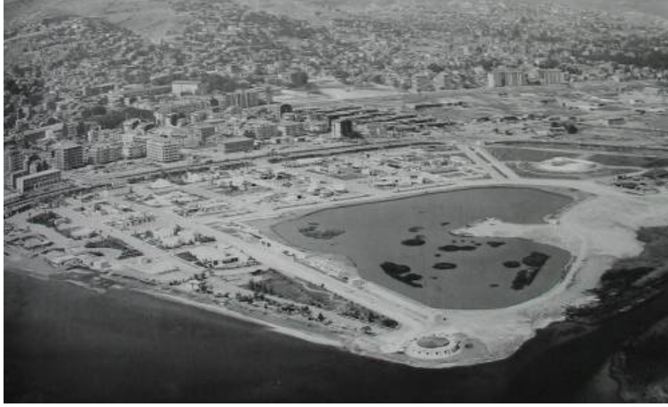
Resim 3, 4, 5: 1974 yılında çekilmiş Fuar Alanı'nın yıl içindeki gelişimini gösteren fotoğraflar

Alanın güneyinde yer alan kullanımlar genellikle 1999 depreminden sonra üniversitenin bu alanda yer seçmesi, depremzedelerin bu alanlara yerleştirilmesi ile oluşmuş, zaman içerisinde depremzedelerin yapımı biten kalıcı konutlara yerleştirilmesi, üniversitenin yeni bir alanda yer seçmesi ve binaların tamamlanıp, taşınması üzerine, dönüştürülmüş ya da el değiştirmiştir. Alanda yer alan Outlet Center 1997 yılında, İnterteks Fuar Alanı 1998 yılında, Grand Yükseliş Oteli 2002 yılında faaliyete geçmiştir.