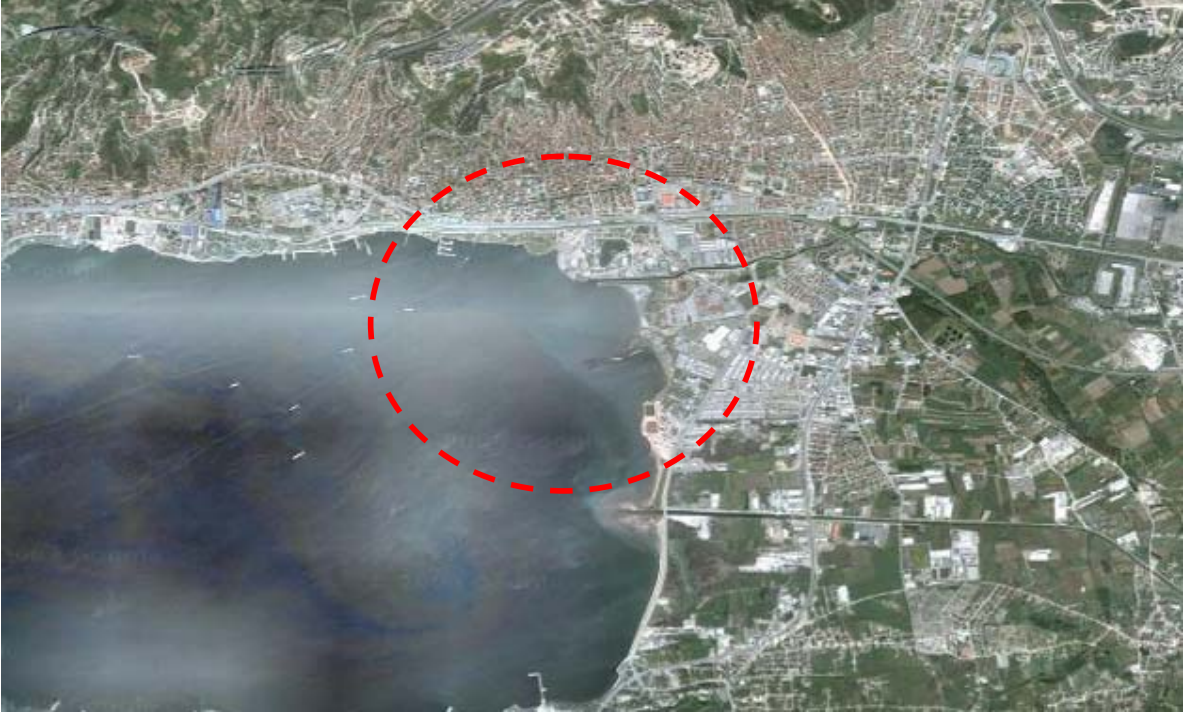
Resim 12: Yarışma Alanının Konumu