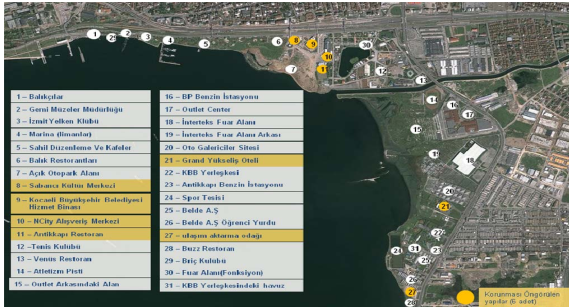
Resim 14: Yarışma alanında yer alan kullanımlar

Aşağıdaki haritada (Resim14) proje alanında yer alan mevcut kullanımlar gösterilmiştir.