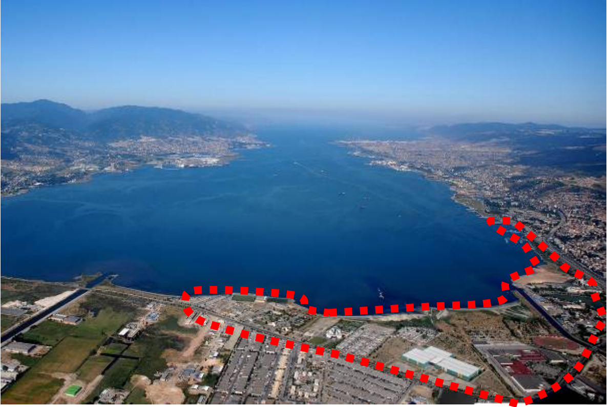
Resim 13: Yarışma alanı ve yakın çevresi