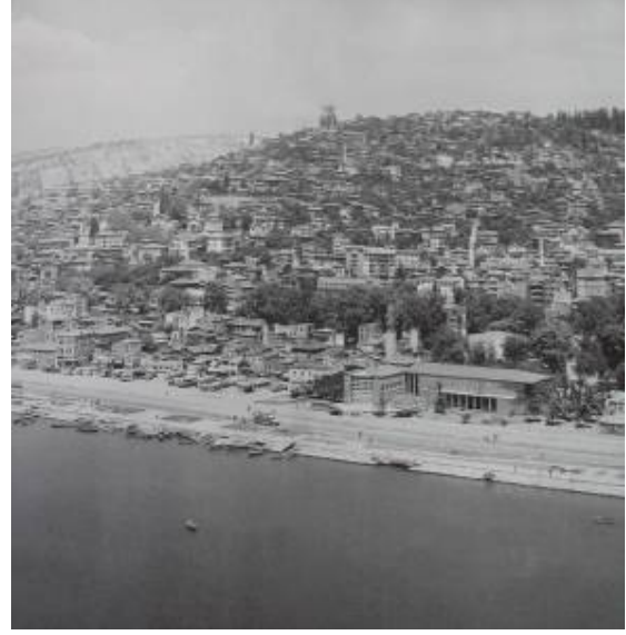
Resim 1, 2: 1960'lı yılların başında, E-5 karayolu yapıldıktan sonra İzmit

Alanın doğusunu oluşturan Fuar Alanı'nın oluşturulma tarihi 1960'lı yılların sonuna denk gelmektedir. Leyla Atakan'ın başkanlık döneminde, düzenlenmeye başlanan geleneksel Sanayi Sergisi'nin yeni adresi olarak yapımı başlanan Fuar Alanı 28.Haziran.1969 yılında "Kocaeli Sanayi Fuarı" adı altında açılmıştır. Günümüzde "Kocaeli Kültür ve Sanat Fuarı" adı altında hizmet veren alan, Kocaeli Büyükşehir Belediyesi, Kocaeli Sanayi Odası ve İzmit Ticaret Odası işbirliği ile düzenlenen festivallere ev sahipliği etmekte, alanda lunapark, oyun alanları, yapay gölet, kültür merkezi, çarşılar, Büyükşehir Belediyesi'ne ait kurumlar, restoran ve barlar, buz pisti bulunmaktadır.