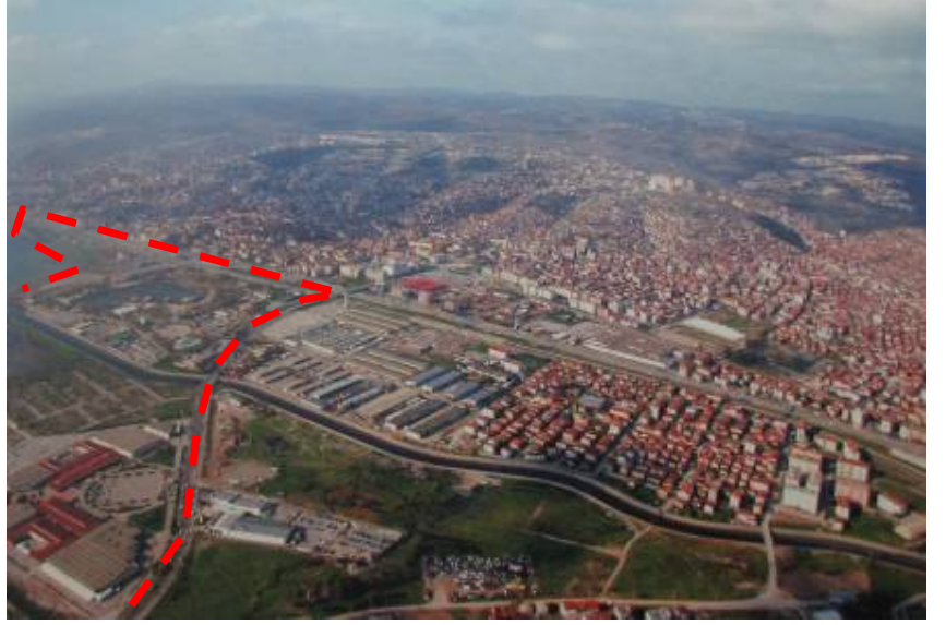
Resim 6, 7, 8, 9: 1972 ve 2001 yıllarında çekilmiş, yarışma alanının bir kısmını ve yakın çevresini gösteren fotoğraflar